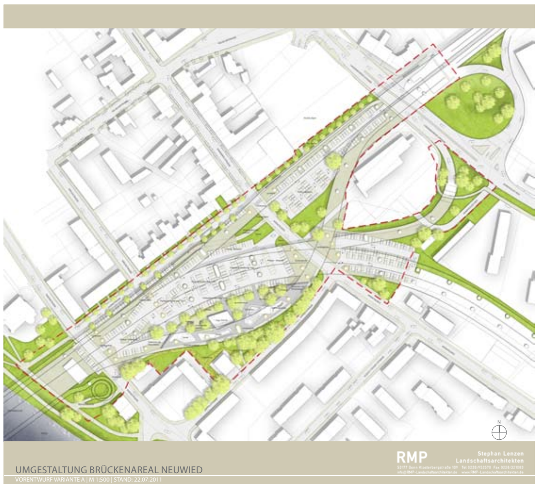
UMGESTALTUNG BRÜCKENAREAL NEUWIED VORENTWURF VARIANTE A | M 1:500 | STAND: 22.07.2011