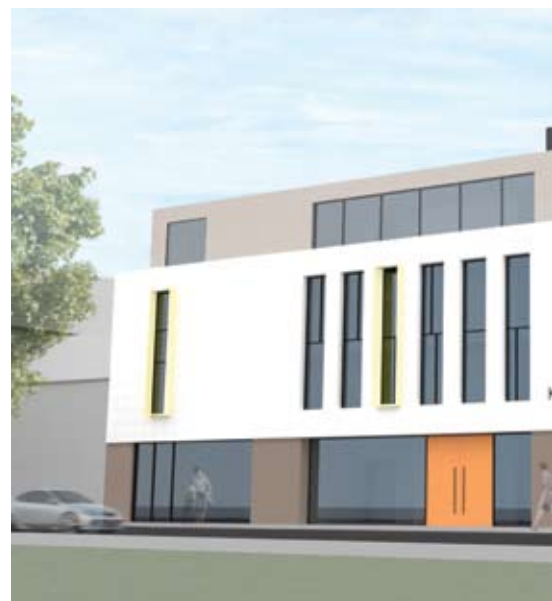
Nach der Fertigstellung soll es dann so dort aussehen.