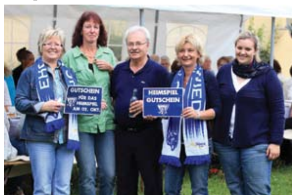
Der EHC verschenkte Freikarten an die Gäste des Gartenfestes

Gästen, die sich wunderbar mit den Gartenfreunden und den Projektleitern unterhielten.