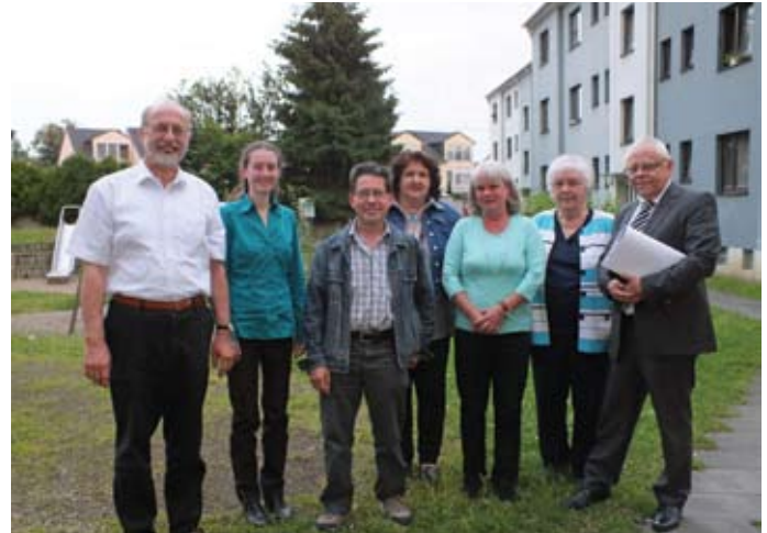
Treffen der Projektgruppe mit der GSG-Geschäftsführung

Vermieter in unserem Stadtteil zu haben. Dies haben wir auch sehr deutlich in einem Gespräch mit den Geschäftsführern zum Ausdruck gebracht. Wir haben der Geschäftsführung unsere Ideen vorgetragen, doch leider war das erste Zusam-