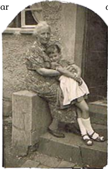
Autorin mit Großmutter