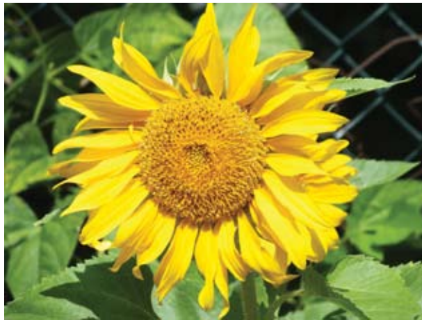
Sonnenblume aus dem Kinderbeet

Wir Gartenfreunde freuen uns drauf die bestehenden zehn Beete liebevoll zu pflegen und nach Herzenslust zu jäten, umzugraben und zu bepflanzen. Auch das Kinder und Jugendbeet wurde mit viel Liebe und Freude von unseren Mädels und Jungen bepflanzt. Unter uns Gärtnerinnen und Gärtner geht es oft um einen Erfahrungsaustausch, zum Beispiel wenn beim