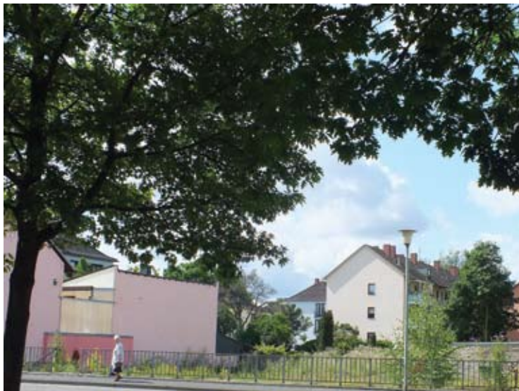
Das Foto zeigt die derzeit noch vorhandene Baulücke im Rheintalweg.

ziel und in dem laufenden Baugenehmigungsverfahren sind nunmehr der neue Stadtteiltreff sowie die Büroräume für Frau Heinz fest eingeplant.